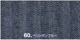
60. ヘリンボンブルー