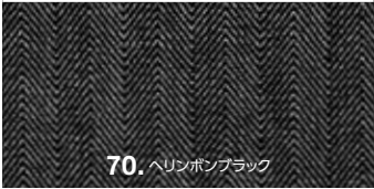
70. ヘリンボンブラック

item ヘリンボンカバーオール price ¥11,000 + 消費税 color 60. ヘリンボンブルー 70. ヘリンボンブラック