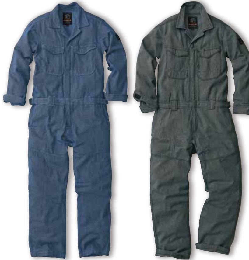
93. ヒッコリーブルー