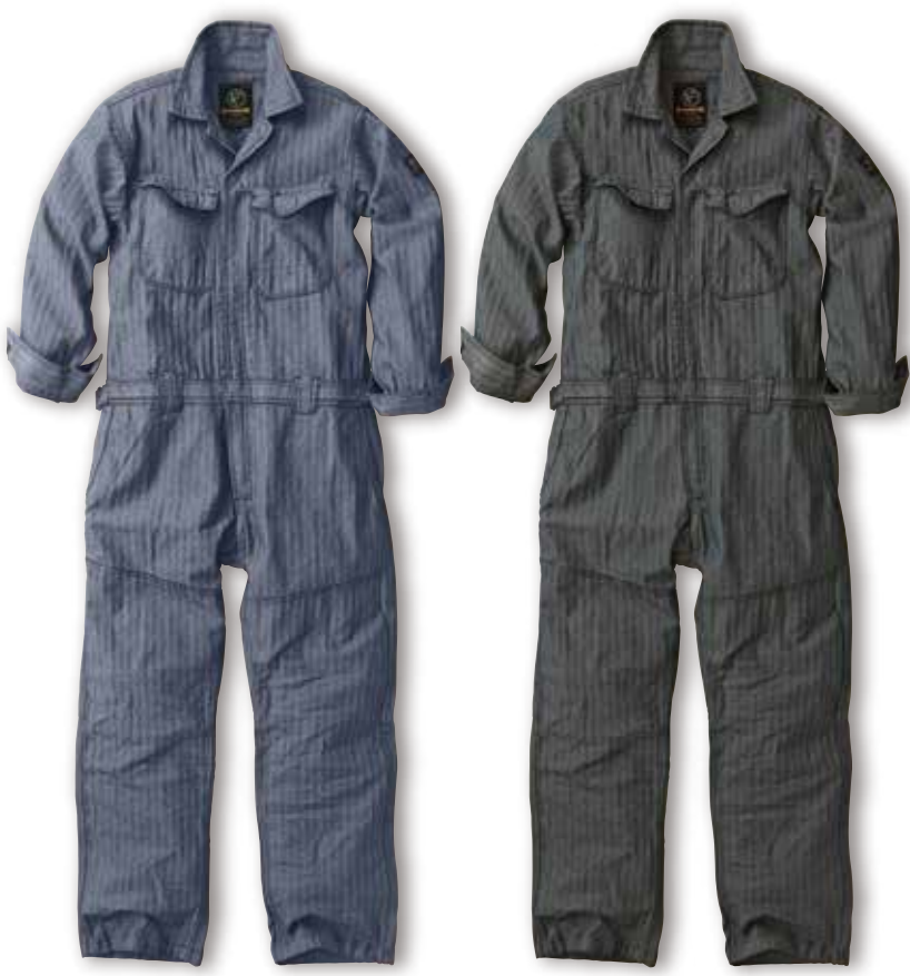
60. ヘリンボンブルー