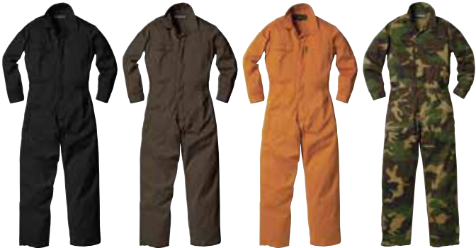
5. ブラック 13. ポリッシュブラウン 14. ポリッシュオレンジ 15. カモフラグリーン

item プレミアムバイオカバーオール price ¥8,700 + 消費税 color 5.ブラック / 13.ポリッシュブラウン 14.ポリッシュオレンジ / 15.カモフラグリーン 26.ブルー