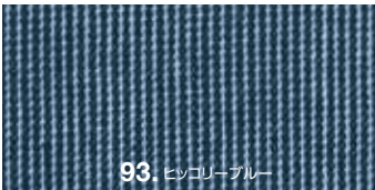
93. ヒッコリーブルー