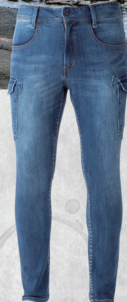
79.ビンテージブルー