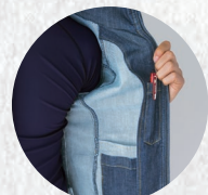
内側ベン差しと小物ポケット内蔵