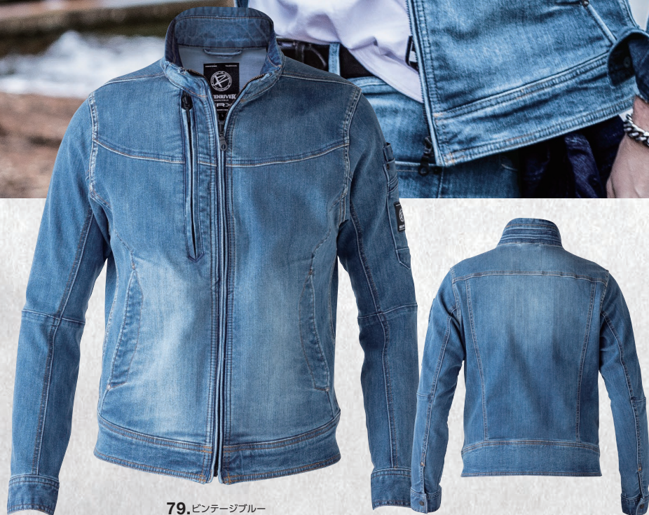
79.ビンテージブルー